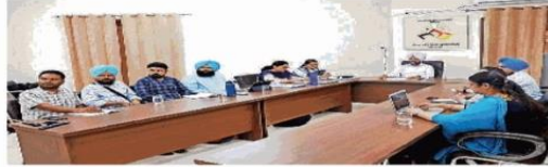
ਜਗਤ ਗੁਰੂ ਨਾਨਕ ਦੇਵ ਪੰਜਾਬ ਸਟੇਟ ਓਪਨ ਯੂਨੀਵਰਸਿਟੀ, ਪਟਿਆਲਾ ਵੱਲੋਂ

ਨਵੀਆਂ ਤਕਨੀਕਾਂ ਅਤੇ ਬੇਜਾਰਬੀ ਵਿਗਿਆਨ ਦਾ ਰੁਝਾਨ ਮਨੁੱਖ ਅਤੇ ਮਸ਼ੀਨ ਵਿਚਕਾਰ ਸੀਮਾਵਾਂ ਨੂੰ ਖੁੰਦਲਾ ਕਰ ਦਿੰਦਾ ਹੈ। ਪੋਸਟ-ਰਿਊਮੈਨੇਜਮ, ਸੱਭਿਆਚਾਰ ਅਤੇ ਪਛਾਣ ਬਾਰੇ ਵਿਚਾਰ-ਵਟਾਂਦਰੇ ਡਿਜੀਟਲਾਈਜ਼ਡ ਸੰਸਾਰ ਦੇ ਸਮਾਜ ਵਿੱਚ ਸੰਤੁਲਨ ਦਾ ਪ੍ਰਬੰਧ ਕਰਨ ਦੇ ਨੈਤਿਕ ਤਰੀਕਿਆਂ ਲਈ ਇਸ ਕਾਨਫਰੰਸ ਰਾਹੀਂ ਸਮਝ ਪ੍ਰਦਾਨ ਕਰਨਗੇ।