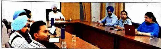
ਜਗਤ ਗੁਰੂ ਨਾਨਕ ਦੇਵ ਯੂਨੀਵਰਸਿਟੀ ਵਿਖੇ ਆਯੋਜਿਤ ਕਾਨਫਰੰਸ ਦਾ ਦ੍ਰਿਸ਼।