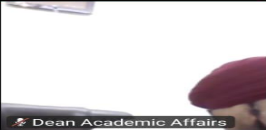
Dean Academic Affairs