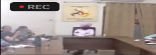
Jagat Guru Nanak Dev Punjab State Open University