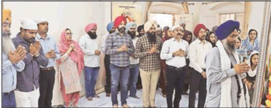
ਯੂਨੀਵਰਸਿਟੀ ਵਿਖੇ ਸ੍ਰੀ ਅਖੰਡ ਪਾਠ ਸਾਹਿਬ ਦੌਰਾਨ ਅਰਦਾਸ ਕਰਦੇ ਅਧਿਆਪਕ।