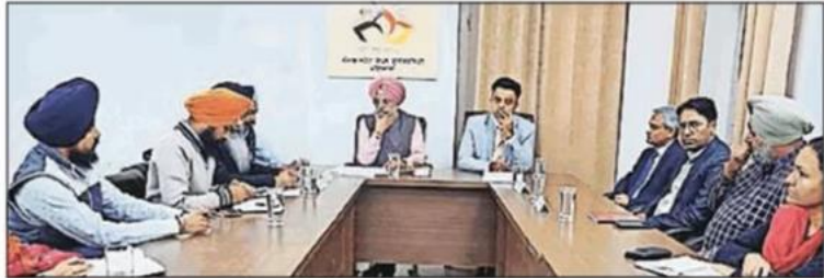
ਨੈਸ਼ਨਲ ਸਕਿੱਲ ਡਿਵੈਲਪਮੈਂਟ ਸੈਸ਼ਨ ਦਾ ਦ੍ਰਿਸ਼।